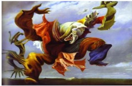
Max Ernst (1891-1976) l'ange du foyer